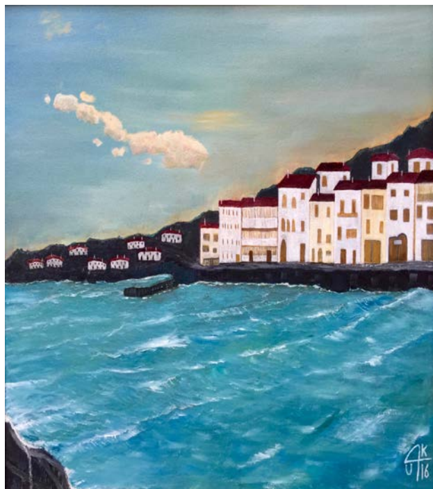
González González, Miguel Alberto. (2016). Cadaqués sueña con Dalí; óleo sobre lienzo