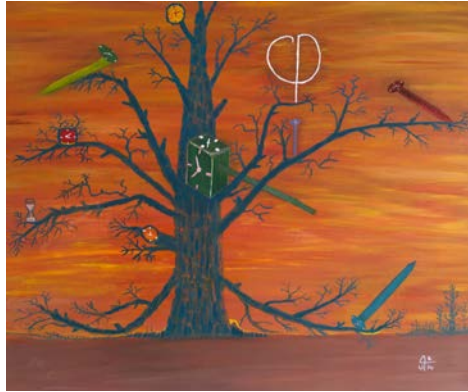
González González, Miguel Alberto. (2014). A punto de; óleo sobre lienzo.